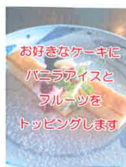
ケーキプレート ケーキメニューから 好きなケーキをお選び下さい

カフェセット ¥950 (珈琲 or 紅茶 ・HOT or ICE) 単品 ¥600