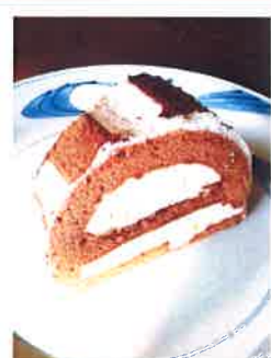
ティラミス マスカルポーネを使用 甘さ控えめのノエル仕立て