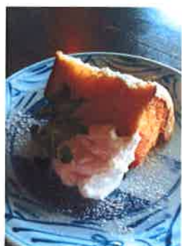
シフォン メイプル メイプルシロップを染み込ませた 生地を焼き上げたシフォンケーキ