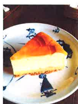
チーズスフレ 洋梨とクリームチーズを 焼き上げたまろやかな味わい