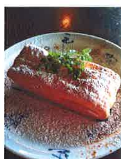
アップルパイ 完熟リンゴをパイに包み シナモンで仕上げます