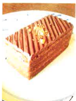
ガナッシュ 生チョコを使った ビターテイストな大人の味わい

カフェセット ¥950 (珈琲 or 紅茶 ・HOT or ICE) 単品 ¥600