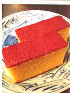
カステラ 卵の風味を生かして、しっとり ふんわりと仕上げたカステラ