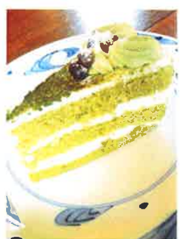
抹茶 抹茶の風味が香るスポンジに 小豆をトッピング