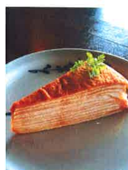
ミルクレープ クレープ生地と生クリームを 重ね合わせた一品