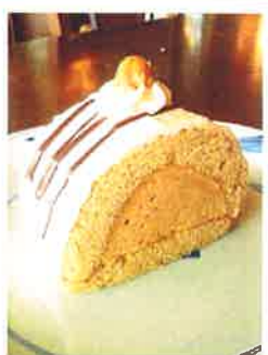
キャラメル ラテ コーヒームースに胡桃、キャラメル のコンフィチュールを合わせました