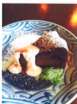
ガトーショコラ しっとり濃厚な生地の定番 大人のチョコレートケーキ

ケーキセット ¥850 (珈琲 or 紅茶 ・HOT or ICE) 単品 ¥500