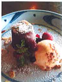
フォンダンショコラ 中からとろりチョコレートが とけ出るリッチなケーキ