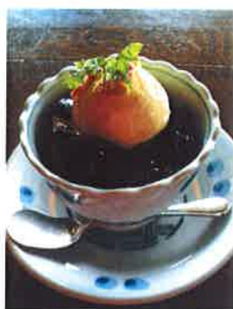
コーヒーゼリー 柔らかな苦味が特徴のゼリーに バニラアイスをトッピング